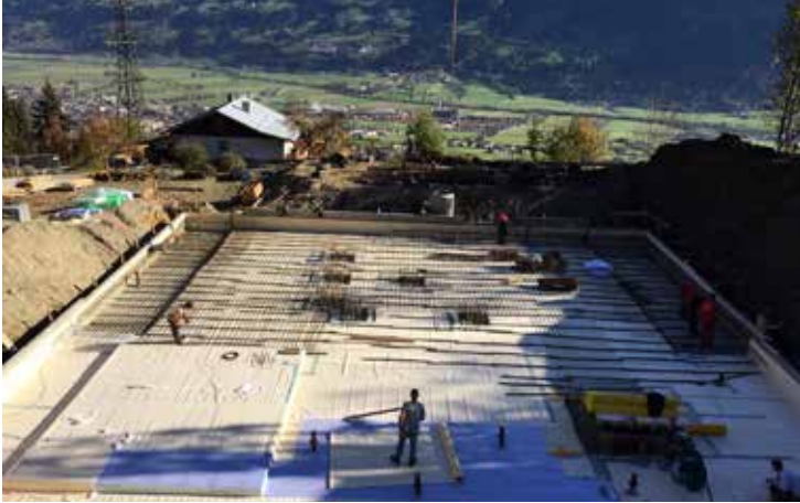
Bild 1: Bewehrungsarbeiten auf der Frischbetonverbundfolie SikaProof® A