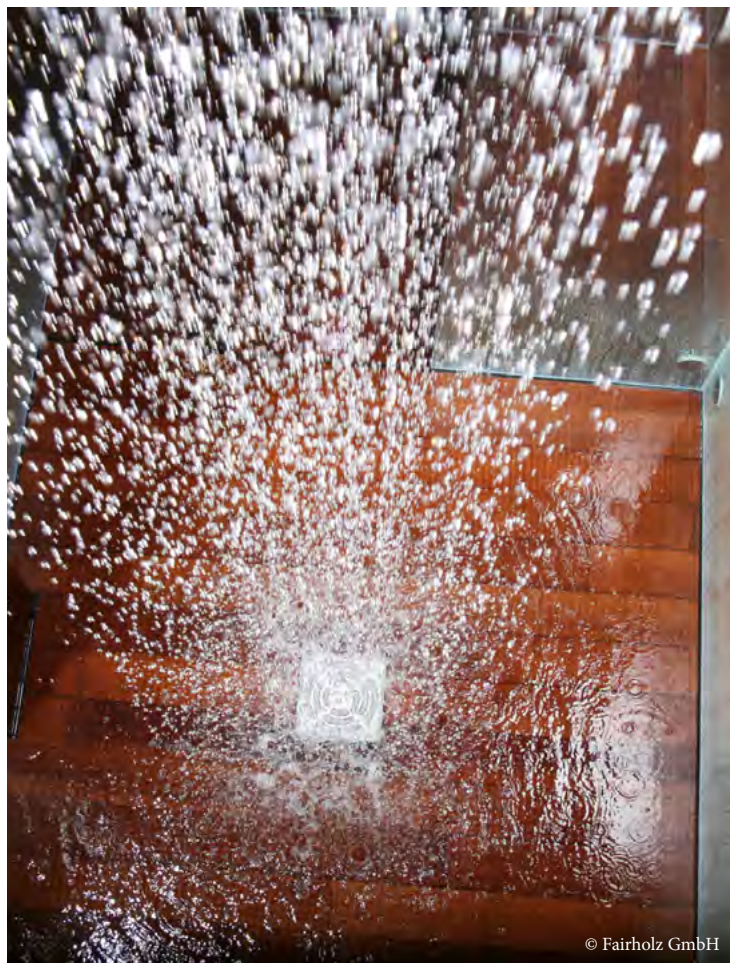
Bild 1: Wasserdichtheit durch Gummiarmierung und SikaBond® Verklebung