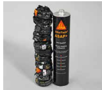
REDUKTION VON VERPACKUNGSABFALL BEI BELRON, USA UNIPACKS FÜR AUTOMOTIVE AFTERMARKET IN DEN USA

Singapur nimmt in Sachen nachhaltiges Bauen eine führende Rolle ein und fordert Bauherren, Architekten und Bauunternehmen nachdrücklich auf, ressourcenschonende Produkte einzusetzen. Die Reduktion des Portland-Zement-Gehalts durch alternative hydraulische Bindemittel erhöht die Ressourceneffizienz nachweislich. Die nachhaltige Mörtellinie von LCS umfasst ein Sortiment an Zementputzen, Fliesenklebern und Estrichen, die im Vergleich zu Produkten mit ähnlicher Leistung um 20% weniger Zement enthalten und den CO 2 -Fußabdruck um mindestens 15% reduzieren. So erfüllt die nachhaltige Mörtellinie von LCS die Anforderungen des Singapore Green Label und hilft Bauunternehmen in Singapur, ihre Ziele zu erreichen.