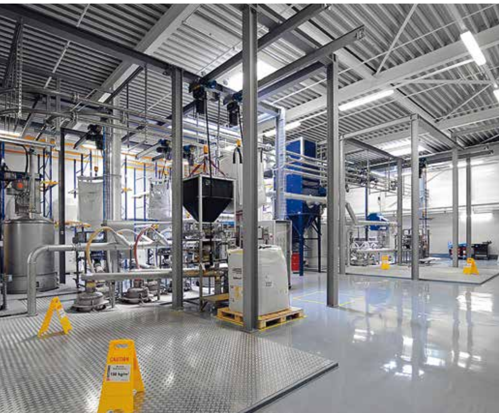
ABWÄRMERÜCKGEWINNUNG, SIKA MANUFACTURING FABRIK DÜDINGEN, SCHWEIZ

Die Produktionslinien für polymere Dachabdichtungen im Sika Werk Canton verbrauchen große Kühlwassermengen. Ein zentrales Steuerungssystem, das die Kühlgeräte, Kühltürme, Pumpen, Ventile sowie den Platten- und Rahmenwärmetauscher steuert, ermöglicht die Nutzung niedriger Außentemperaturen während der kalten Jahreszeit, wodurch der jährliche Stromverbrauch um fast 6% sinkt. Zusätzlich stammt ein Drittel der Energie, die für den Bürobetrieb benötigt wird, aus der Dachsolaranlage.