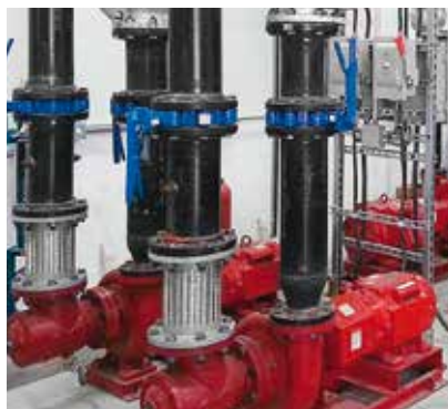
GESCHLOSSENER KÜHLWASSER-KREISLAUF, SIKA CORPORATION FABRIK LYNDHURST, USA

In Barranquilla würde die Wasserversorgung für die Produktionsprozesse nicht ausreichen. Deshalb wird Regenwasser gesammelt, gefiltert und für die Verwendung in den industriellen Prozessen aufbereitet. Rund 31.000 Liter Regenwasser werden gesammelt – das entspricht 11% des Gesamtwasserverbrauchs. Außerhalb von El Niño-Jahren würde sich diese Menge verdreifachen. Darüber hinaus ermöglicht ein hochmoderner Wasseraufbereitungsprozess, das aufbereitete Wasser in das kommunale Abwassersystem zu leiten.