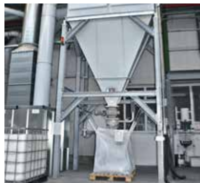
WIEDERVERWENDUNG VON FILTER-STAUB IN DER PRODUKTION, SIKA DEUTSCHLAND FABRIK ROSENDAHL, DEUTSCHLAND

Die Sika Anlage in Lyndhurst, NJ, verbrauchte große Mengen von kontaktfreiem Kühlwasser aus den eigenen Grundwasserbrunnen im Produktionsprozess für Dicht- und Klebstoffe. Im Jahr 2014 investierte das Werk in einen geschlossenen Kühlkreislauf, um den Wasserverbrauch zu senken und die Kühlkapazität zu verbessern. Dadurch werden Wassereinsparungen von mehr als 80% erzielt und der jährliche Wasserverbrauch von 600.000 m 3 auf 100.000 m 3 reduziert.