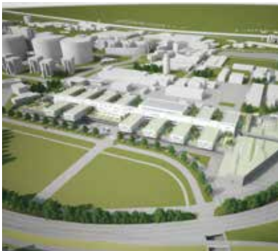
ÖGNI GOLD PROJEKT, ÖSTERREICH SIKA DACHLÖSUNG FÜR SMART CAMPUS IN WIEN

Durch maßgeschneiderte Verpackung eingespart