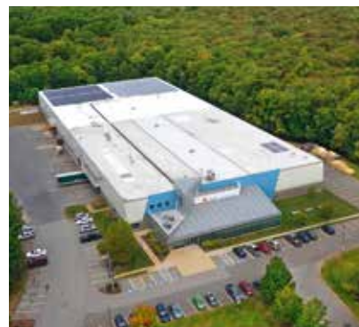
ENERGIESPARPROGRAMM UND SOLARENERGIEERZEUGUNG, SIKA CORPORATION FABRIK CANTON, USA

Sika ViscoCrete Betonpolymere sind eine von Sika entwickelte Technologie, die in Rezepturen für Betonzusatzmittel zum Einsatz kommt und die Fließbarkeit, Verarbeitbarkeit und Haltbarkeit des Betons erheblich erhöht. In intensiven Forschungsarbeiten wurde eine hoch konzentrierte Formel entwickelt, die den Energieverbrauch in der Produktion verringert und 12% der jährlichen Schüttgut-LKW-Lieferungen (80 Lieferungen) aus der wichtigsten Sika ViscoCrete Produktionsanlage in Zwiwindrecht an europäische Sika Betonbindemittelfabriken überflüssig macht.