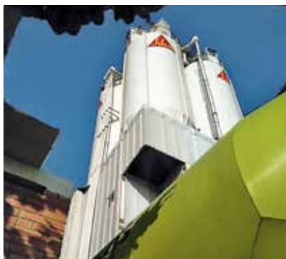
PRODUKTION AUF REGENWASSER-BASIS, SIKA KOLUMBIEN FABRIK BARRANQUILLA, KOLUMBIEN

In Barranquilla würde die Wasserversorgung für die Produktionsprozesse nicht ausreichen. Deshalb wird Regenwasser gesammelt, gefiltert und für die Verwendung in den industriellen Prozessen aufbereitet. Rund 31.000 Liter Regenwasser werden gesammelt – das entspricht 11% des Gesamtwasserverbrauchs. Außerhalb von El Niño-Jahren würde sich diese Menge verdreifachen. Darüber hinaus ermöglicht ein hochmoderner Wasseraufbereitungsprozess, das aufbereitete Wasser in das kommunale Abwassersystem zu leiten.