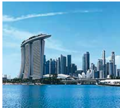
DESIGN FÜR BESSERE RESSOURCEN-EFFIZIENZ, SINGAPUR NACHHALTIGE MÖRTEL VON LCS OPTIROC SINGAPUR

Der österreichische Energienetzbetreiber Wiener Netze in Wien unterstützt Kunden beim Energiesparen und verfolgt selbst ehrgeizige Ziele hinsichtlich Energie- und Ressourceneffizienz für seine neue, ÖGNI Gold-vorzertifizierte Zentrale. Der Eigentümer suchte nach einer qualitativ hochwertigen und langlebigen Dachlösung mit gutem Umweltprofil, die durch Umweltproduktdeklarationen (EPD) bestätigt ist, um die angestrebte Green Building-Zertifizierung zu erreichen.