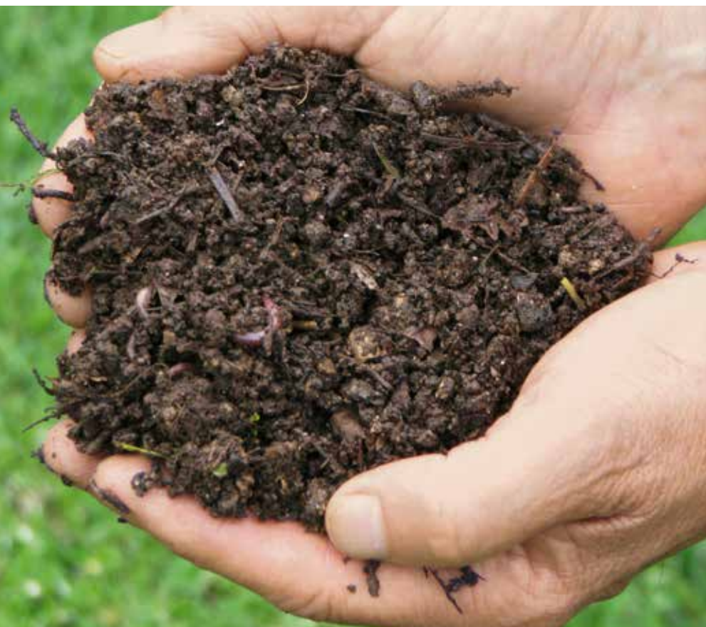
ABFALL, DER SICH AUSZAHLT, SIKA KOLUMBIEN FABRIKEN RIONEGRO UND TOCANCIPA, KOLUMBIEN

Im Werk Rosendahl stellt Sika Mörtel für Innenausbauarbeiten her, die größtenteils in Säcken verkauft werden. Staub an der Verpackungsstation wurde früher abgesaugt und als Abfall entsorgt. Heute wird der Staub für ähnliche Produkte wiederverwendet, wodurch jährlich bis zu 150 Tonnen an ehemaligem Abfall wiederverwendet werden.