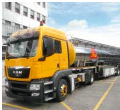
NEUE VISCOCRETE POLYMERE MIT HOHEM FESTSTOFFANTEIL, SIKA BELGIEN FABRIK ZWIJNDRECHT, BELGIEN

Traditionelle Beleuchtungsformen in Lagern und Produktionsbereichen der Mörtel- und Betonzusatzmittelproduktion erfordern erhebliche Energiemengen. Die Beleuchtung an verschiedenen Standorten wie Kirchberg (Schweiz), Rosendahl (Deutschland), Bludenz (Österreich), Bratislava (Slowakei) und Gournay (Frankreich) wurde durch die neueste LED-Technologie ersetzt. Die langlebigen, sofort startenden und schnell schaltenden Lampen führen zu deutlichen Energie- und Kosteneinsparungen. In Rosendahl werden diese Lampen etwa 60% des Gesamtstromverbrauchs für Beleuchtung einsparen.