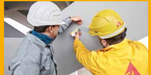
SERVICE UND BERATUNG AUF DER BAUSTELLE