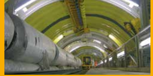
TUNNELBAU UND BAUWERKSABDICHTUNG