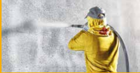
BETONSCHUTZ UND INSTANDHALTUNG