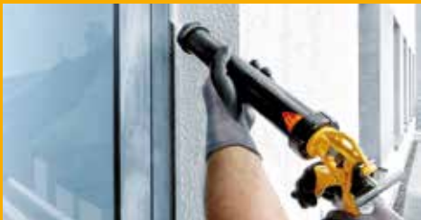
KLEBEN UND DICHTEN AM BAU