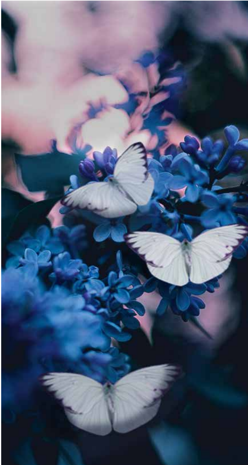
Inspiriert durch unsere Umwelt