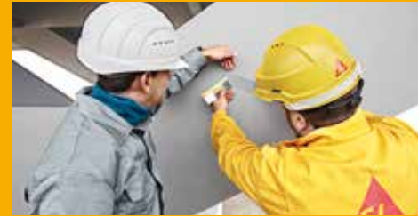
SERVICE UND BERATUNG AUF DER BAUSTELLE