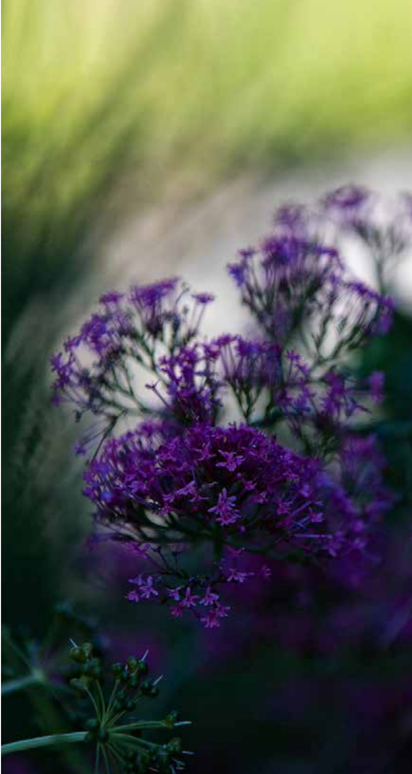
Inspiriert durch unsere Umwelt