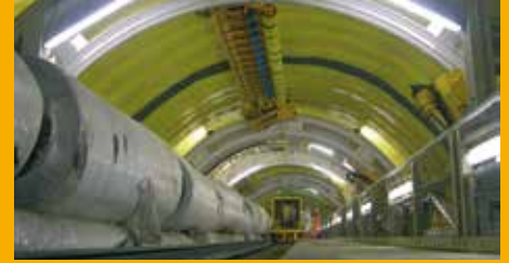
TUNNELBAU UND BAUWERKSABDICHTUNG