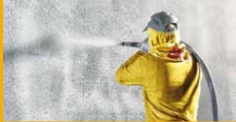
BETONSCHUTZ UND INSTANDHALTUNG