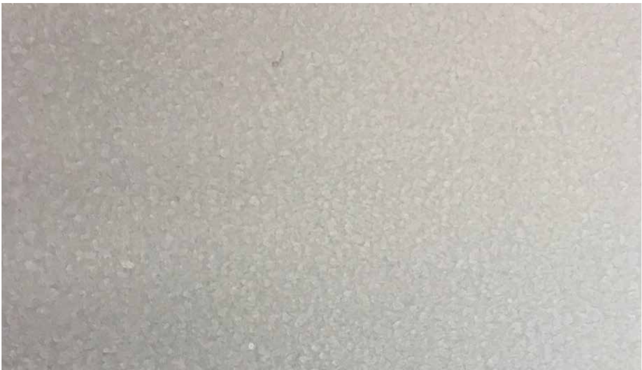
Ein einheitlicheres Muster kann durch Verwendung anderer Rollerarten erreicht werden.