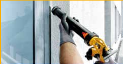
KLEBEN UND DICHTEN AM BAU