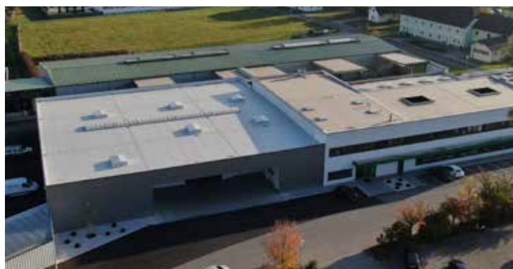
Bild 3: Patentierte Hybrid-Technologie: Sarnafil® AT