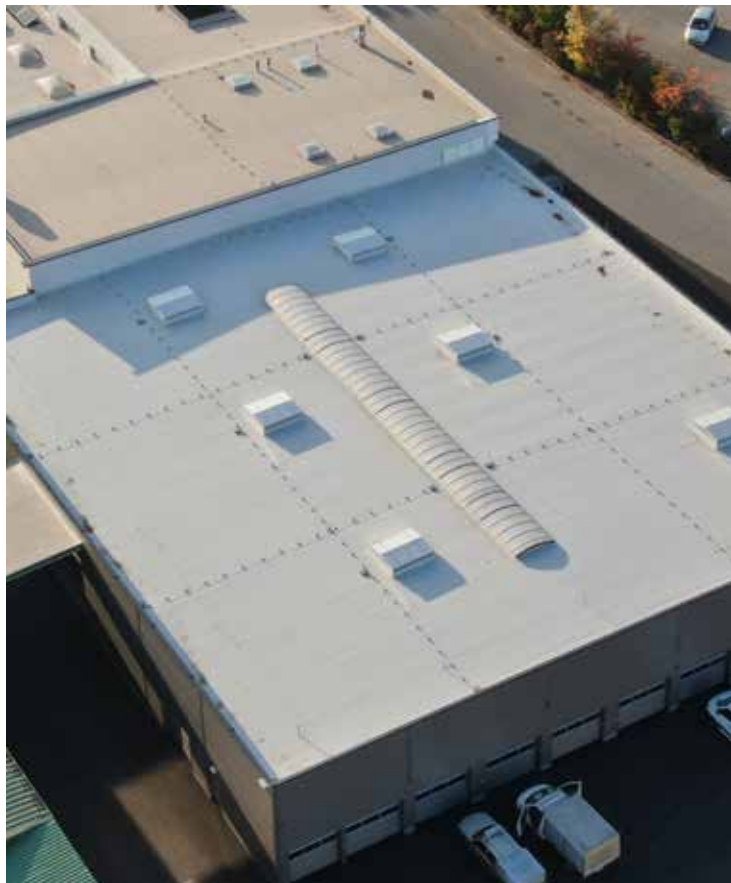
Bild 1: Beim Ausbau wurden 1.400 m 2 Dachfläche mit Sarnafil® AT abgedichtet