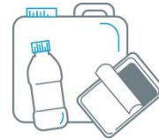
Verpackung & Gefahrguttransport