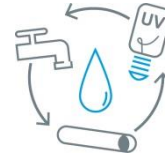
Wasseraufbereitung, Armaturen & Rohrleitungstechnik