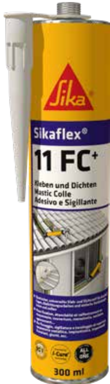
Farben: weiß, grau, schwarz